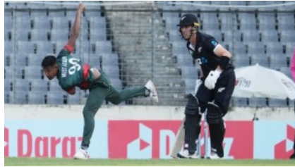
সাকিব-মিরাজদের সামলাতে 'প্রস্তুত' নিউজিল্যান্ড