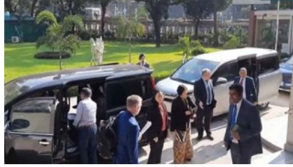
বিকেলে আ.লীগ কার্যালয়ে যাবে মার্কিন প্রাক-নির্বাচন পর্যবেক্ষক দল