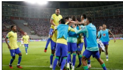
ব্রাজিলকে রুখে দিল ভেনেজুয়েলা