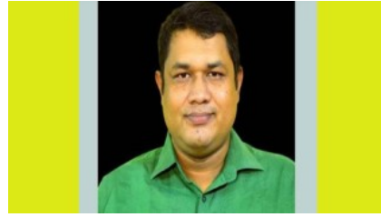
কক্সবাজারে গালগুণে ফেঁসে গেলেন এক ইউপি চেয়ারম্যান