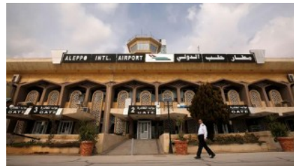
সিরিয়ায় ইসরায়েলের হামলা আন্তর্জাতিক আইনের চরম লঙ্ঘন : রাশিয়া