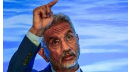
চীনকে নিয়ে ভারত মহাসাগরের দেশগুলিকে সতর্কবার্তা জয়শংকরের