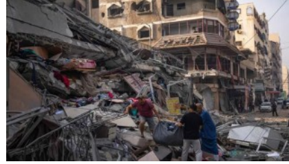
ইসরায়েল-হামাস যুদ্ধ : নিহত ছাড়াই ২ হাজার ৮০০