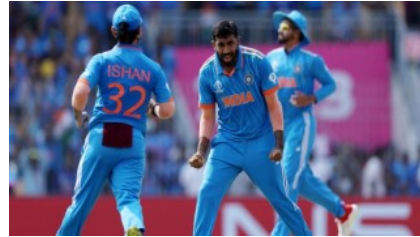
পাকিস্তান ম্যাচের আগে মায়ের সাথে দেখা করতে চান বুমরাহ