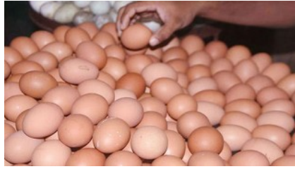
বিশ্ব ডিম দিবস আজ